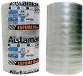
ESPUMA ALUMINIZADA TIPO ISOLAN: DE 5 MM O SUPERIOR.