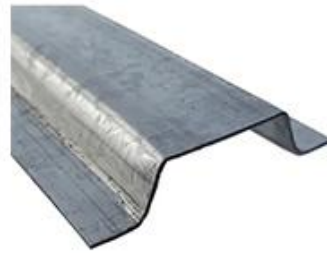
CLAVADERA METÁLICA TIPO OMEGA