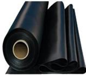
MANTA PLÁSTICA TIPO RUBEROID