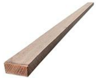
CLAVADERA DE MADERA